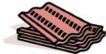
An der Ziegelei